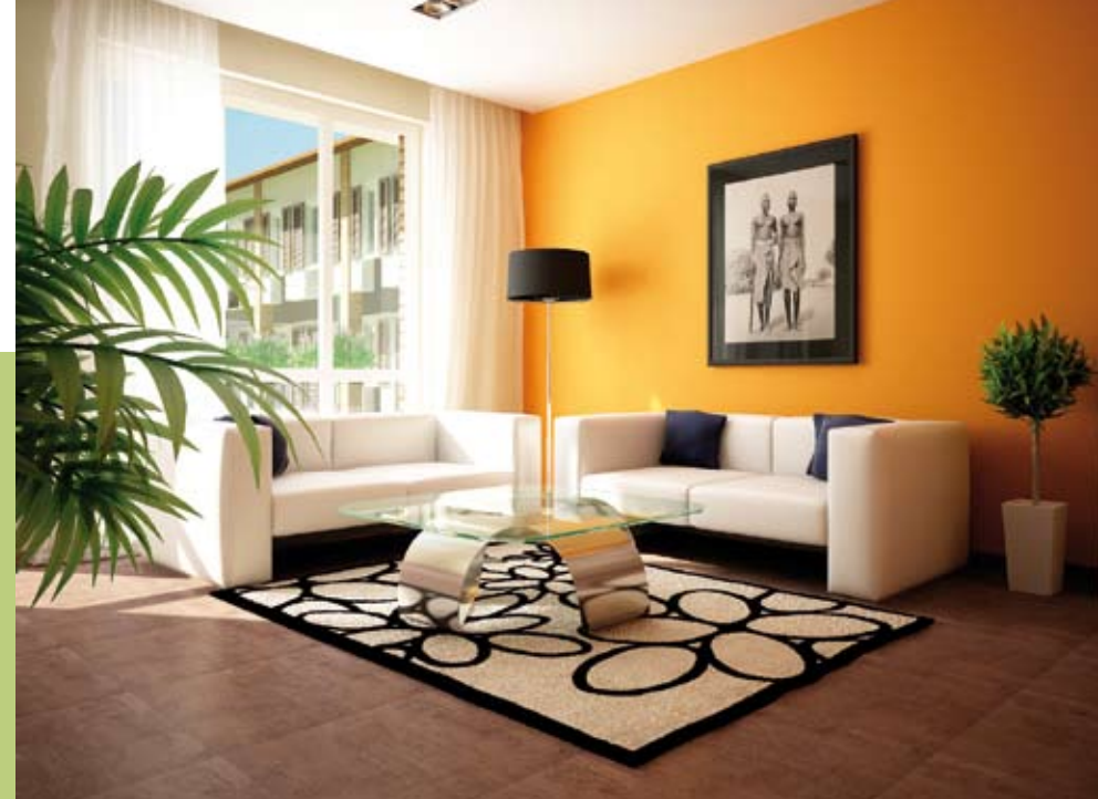
render Laboratorio 51